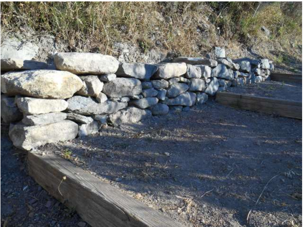
Simulazione muro a secco F2 , prospetto percorso pedonale (PARC).