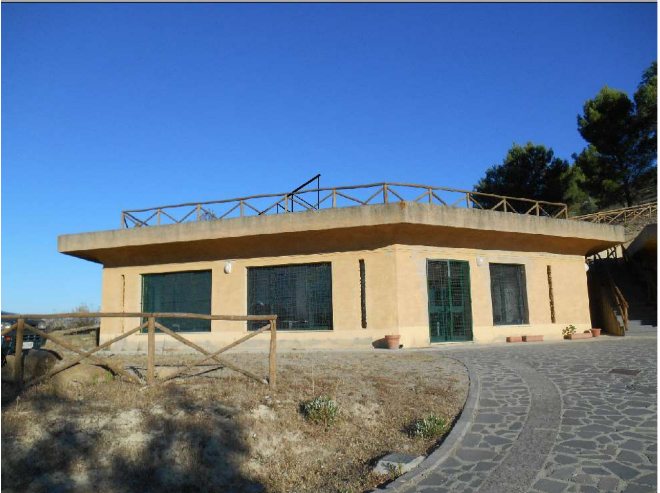
Ricostruzione sulla foto F1 , prospetto edificio (PARC).