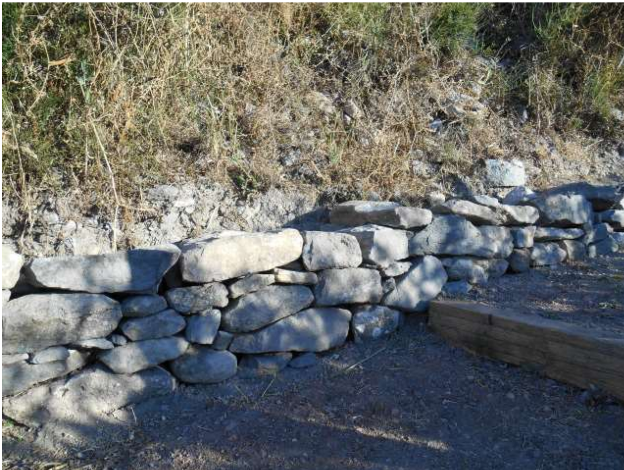
Simulazione muro a secco F3 , prospetto percorso pedonale (PARC).