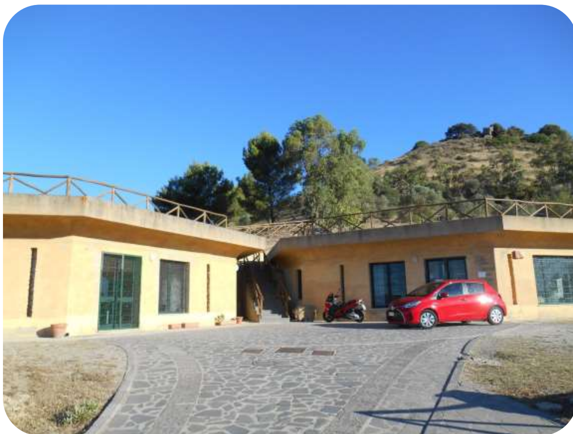
Ufficio Tecnico Comunale